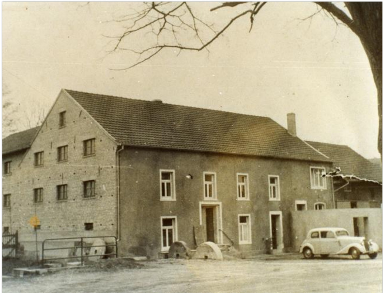
Die Ramachers Mühle um 1950 fotografiert, in der heute Gastronomie betrieben wird und der Historische Verein sein Domizil hat.